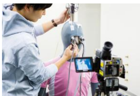
発汗サーマルマネキン

第1部では以下の設備+風洞実験装置の見学に加え、サーマルマネキン発汗状態での測定デモを行う予定です。見学時間は30分と短いですが、公開研究集会中の休憩時間や終了後にゆっくりとご見学頂く事も可能です。ご質問につきましても適宜対応させていただきます。