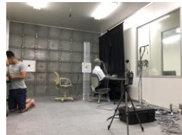
アクティブ制御マルチファン人工気候室